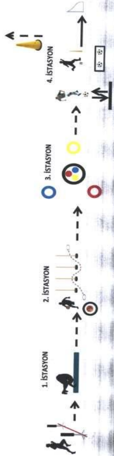
A) KOORDİNASYON PARKURU (45 Puan)